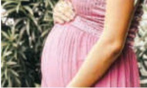
पड़ेगा। अर्बांशन सुनवाई के लिए सुप्रीम कोर्ट के सामने यह मामला आया था।

सुप्रीम कोर्ट ने 14 साल की उस लड़की के मेडिकल एग्जामिनेशन का आदेश पारित किया है जिसकी प्रियंसे 28 हफ्ते की है। लड़की सेक्सुअल असॉल्ट की शिकार है और उसकी मां की ओर से दाखिल याचिका में प्रियंसे टर्मिनेशन की इजाजत मांगी गई है। सुप्रीम कोर्ट के चीफ जस्टिस डीवाई चंद्रचूड़ की अगुआई वाली बेंच ने इस मामले की शुक्रवार को अर्बांशन याचिका पर सुनवाई की। अब सामंवार को इस मामले में सुनवाई होगी।