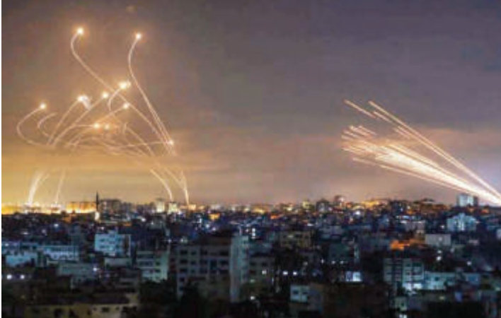
हिज्बुल्ला के कमांडर कह रहे शांति की बात

इजरायल और ईरान के बीच संघर्ष चल रहा है। रविवार के शुरुआती घंटों में इजरायल पर ईरान ने हमला किया था। अब इजरायल ने ईरान से बदला लेना शुरू कर दिया है। इजरायल ने ईरान पर मिसाइल दागे हैं। रिपोर्ट के मुताबिक इजरायली मिसाइलों ने ईरान में टारगेट्स को हिट किया है। बताया यह भी जा रहा है कि सीरिया और इराक में भी हमला किया गया। हालांकि इसकी पुष्टि अमेरिकी अधिकारियों ने नहीं की है। लेकिन कई रिपोर्ट्स में दावा किया गया है कि सीरिया के अस-सुवेदा गवर्नर और इराक के बगदाद क्षेत्र और बाबिल गवर्नर में जोरदार धमाकों की आवाज सुनी गई है।